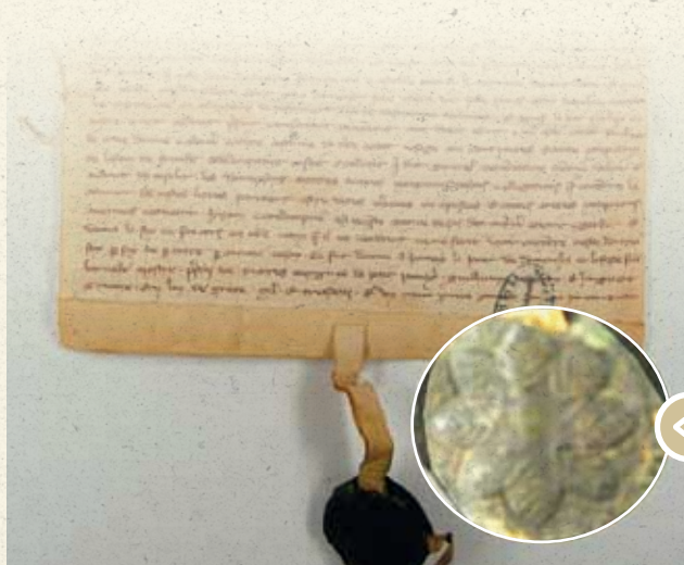
En médaillon, le blason original